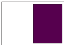
1/2 Seite hoch