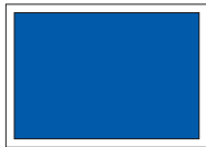
1/1 Seite quer