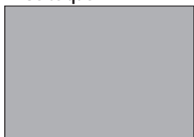
1/2 Seite hoch